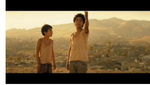
E 5: "Nach Amerika!"